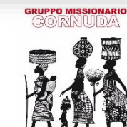
Gruppo Missionario Cornuda