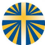
Azione Cattolica Cornuda