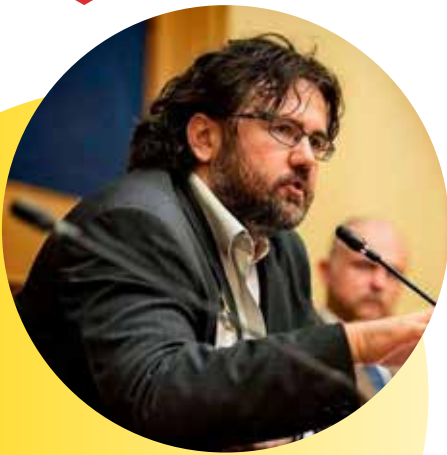
Marco Omizzolo giornalista, ricercatore Eurispes